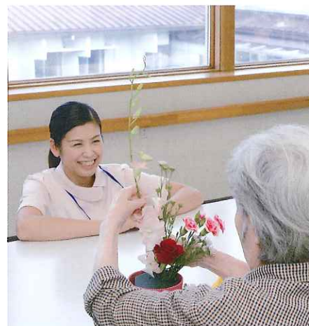
職員サポートのもと、生け花や切り絵など、アクティビティによる作品制作にも取り組んでおられます。

現在、地域の施設からの認知症研修や、看護大学の老年看護学実習を受け入れており、入所者の方々と関わりを持つ事で、入所者だけでなくスタッフにも良い刺激となり、日々の生活、業務の活性化に繋がっています。