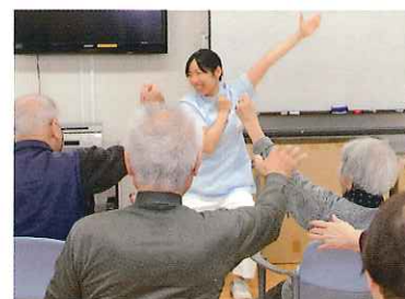
トレーナー体操。楽しみながら体力・機能維持に取り組みます。