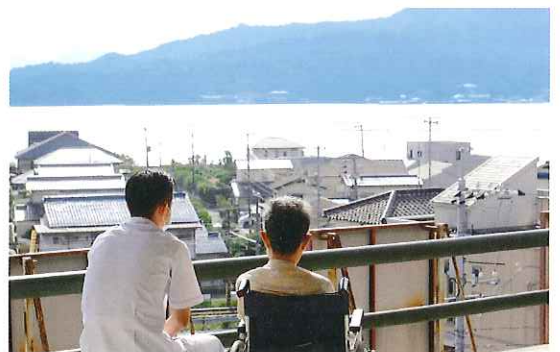
天気の良い日は宮島を一望できるテラスでひなたぼっこも。

また、在宅復帰が困難な入所者の方もその都度、療養環境の整備を行うと共に、ご希望される退所先を支援いたします。