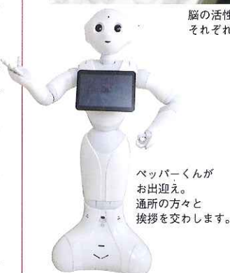
ベッパーくんがお出迎え。通所の方々と挨拶を交わします。