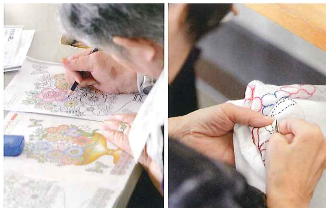
脳の活性化や意欲維持・回復を目的としたアクティビティ。それぞれのペースで楽しみながら完成を目指します。

土肥施設長が利用者へ直接セルフケアの方法を指導して、実践された利用者から「便秘が改善した」「寝つきが良くなった」「足が楽になった」など喜びの声を頂いております。